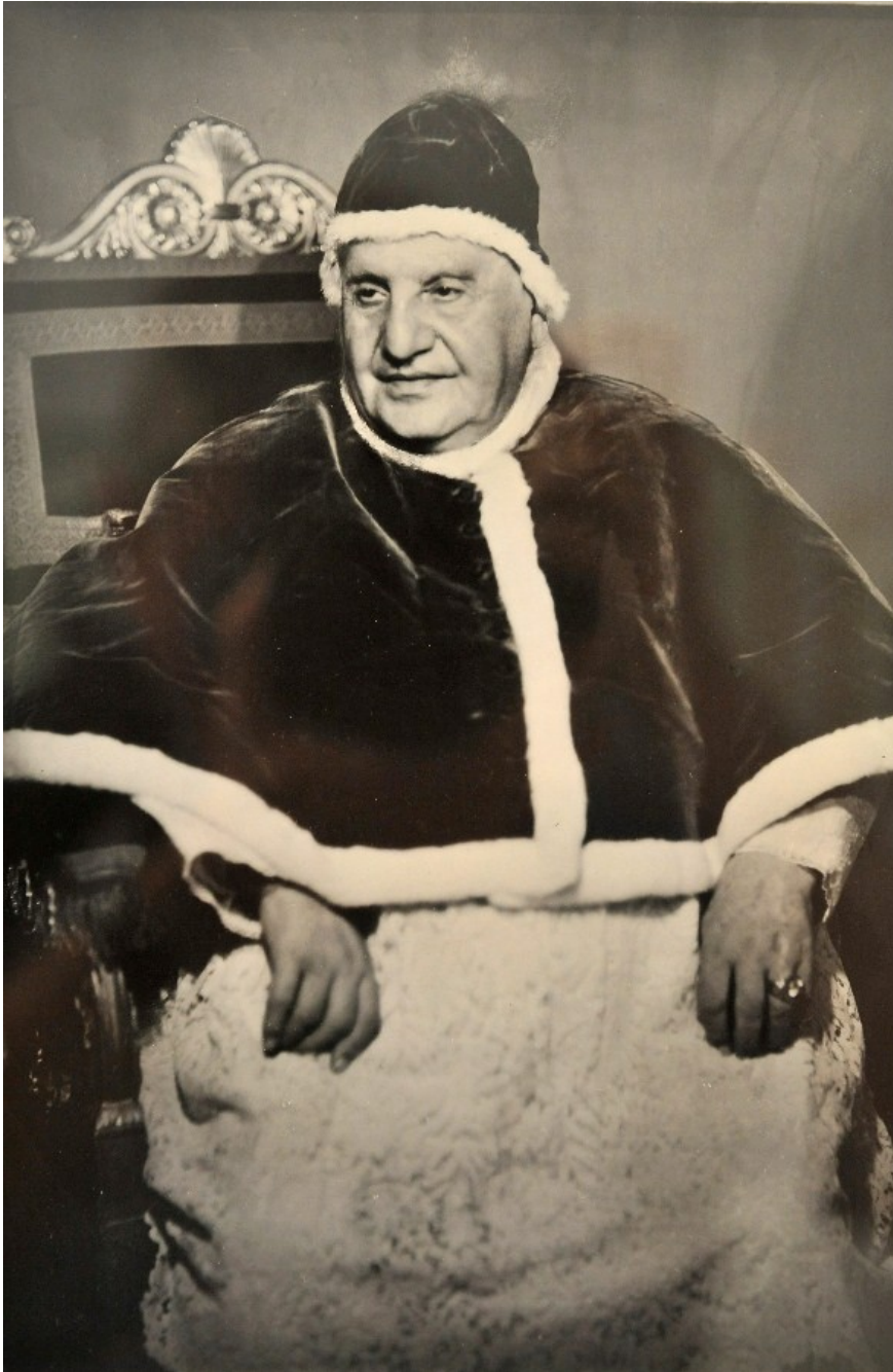
XXIII. János pápa 1958-ban készült portréja.