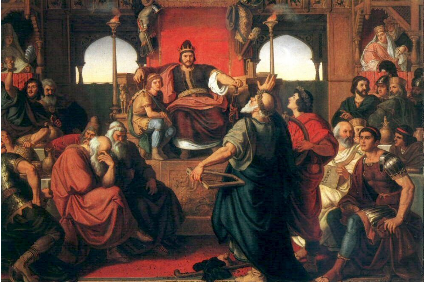
A hunok nagyfejedelme, Attila római követeket fogad egy XIX. századi romantikus festményen Fotó: Wikimedia Commons/Than Mór

A hunok a Krisztus utáni 370-es évek végén törtek be Kelet-Európába, ahol megalapították a történelem egyik legerősebb nomád birodalmát. Ez a kelet- és nyugatrómai impériumot egyaránt felforgató birodalom azonban alig néhány évtizeddel később szétesett. A történelmi közgondolkodásban a hunok Attila harcos népével azonosak, pedig az a helyes, ha nem csak egyetlen hun birodalomról beszélünk.