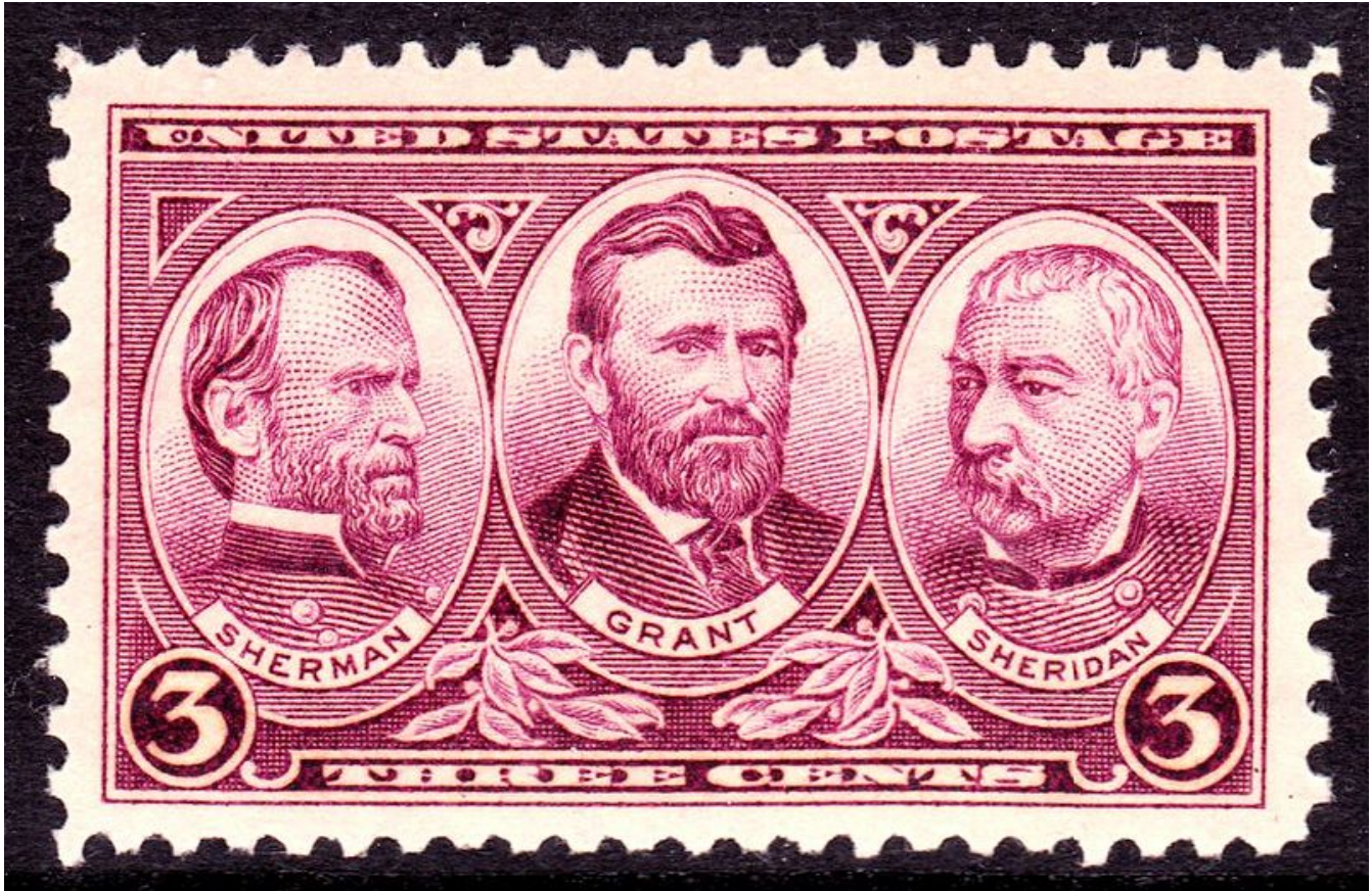
Sherman - Grant - Sheridan 1937-es emlékbélyeg a három tábornok arcképével

nevét adták, mert az volt a szándékuk, hogy akárcsak egy óriáskígyó, körbefonják és megfojtják a déli államok teljes területét. Velük nevetett az egész világ a blokád ötletén, annyira gyerekesnek t?nt a déli államok kiéheztetése, hogy senki nem vette komolyan. Senki sem számolt ugyanis Sherman karakterével. Grant, Lincoln és a többi északi vezet? hallani sem akart az Anaconda-tervr?l, Sherman viszont egy szociopata perverz ösztönével kezdett?l fogva megérezte a benne rejl? korlátlan lehet?ségeket. Ugyanakkor nagyon is tisztában volt azzal, hogy egy abnormális elképzelést nem lehet normális módszerekkel végrehajtani. Egyébként a blokád, amelyet?l a háború humanizálását remélték, elismerte a jog. Ezért gondolta azt a világ kés?bb, hogy az északi és déli államok közötti háború elég ártatlan dolog volt. Valójában a blokád függönye mögött rettenetes b?nöket követtek el.