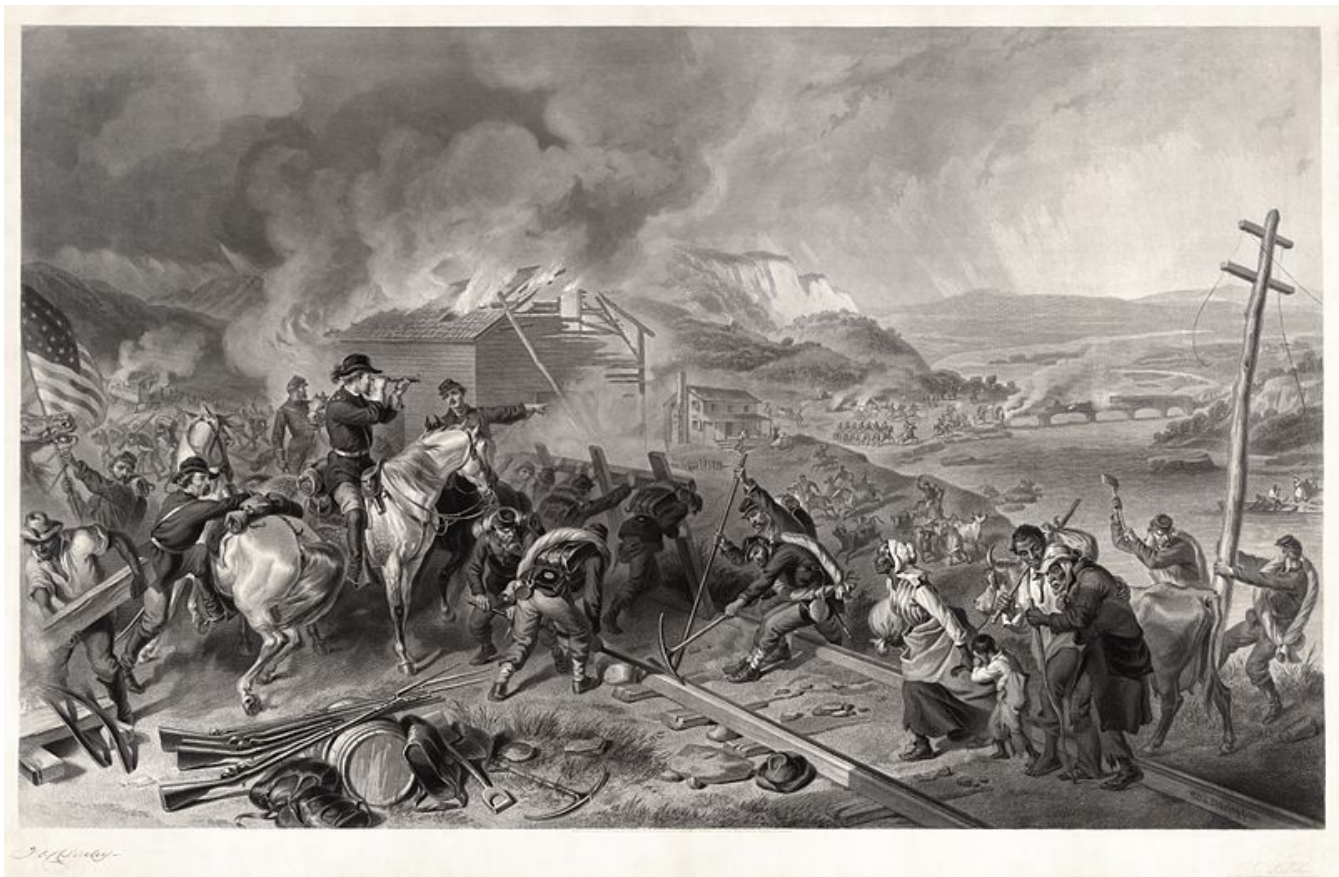
Egy 1868-os rézkarc amely Sherman menetelését ábrázolja: az északi katonák megsemmisítik a déli államok infrastruktúráját

Az amerikai polgárháborúról, más néven a secessziós háborúról beszélünk. A rómaiak az emancipációs erőfeszítésekre alkalmazták a secessio (elszakadás) kifejezést. De mindazt, amit Európa ebben a fajta háborúban láthatott, messze felülmúlta az USA északi államai által a déli államok ellen indított háború, amelynek hivatalos indoka a rabszolgaság eltörlése volt. Noha az északi államok fel akarták szabadítani a néger rabszolgákat, a háború végén mégis mintegy százezer fekete önkéntes harcolt felszabadítóik hadserege ellen. A vérmérséklet és a vallási fanatizmus a világtörténelem egyik legvéresebb mézárulásává változtatta ezt a háborút, amely mind a tengeren, mind a szárazföldön teljesen új formákat öltött magára (aknamezőket telepítettek és megjelentek az első páncélos csatahajók). A békekötés után csak nagyon kevesen tudták meg, hogy valójában mi is történt Georgiában. A nemzetközi közvéleményt alig érdekelte, mert Európában éppen akkoriban robbant ki a német–francia háború. Ráadásul az amerikai propaganda gondoskodott róla, hogy a világot csak „Tamás bátya kunyhójának” szirupos történetei foglalkoztassák.