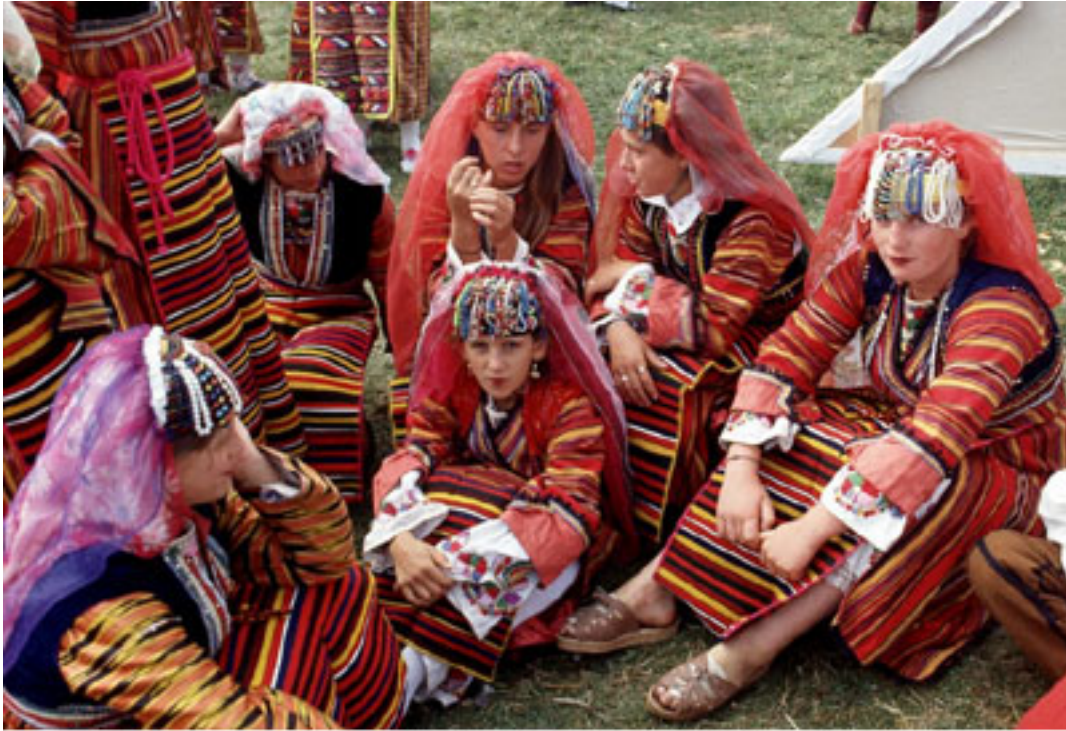
Pomak women, dressed in traditional costume, at a festival in Bulgaria.