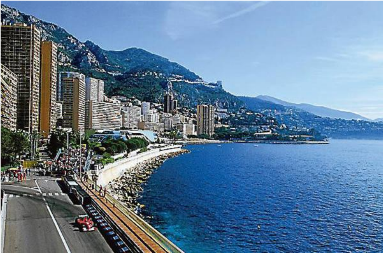
Fest?i szépség? mili? övezi a monte-carlói aszfaltcsíkot

Az ünnepi futam remélhet?leg hozzá ill? izgalmakat hoz majd. A sz?k utcai versenypályán jóval nagyobb szerep jut a versenyz?i kvalitásnak, mint más pályákon, nem véletlen, hogy az elmúlt hat évtized világhíres pilótái mind-mind nyerni tudtak a hercegségben. Az esélyek itt is a Red Bull sikerét ígérik, de Alonso, Schumacher és Hamilton lesben áll már az alkalomra, hogy újabb diadalt arasson az unikális helyszínen.