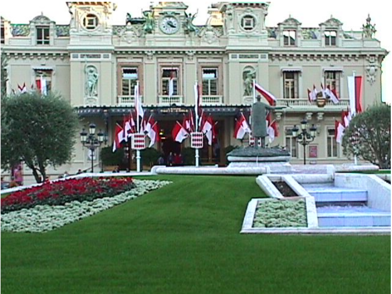
A monacói hercegi palota