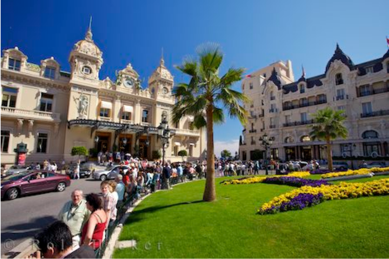
A Hotel Casino épülete

konzervatív hercegségnek mára liberális elveken nyugó alkotmánya van, adóparadicsommá lett.