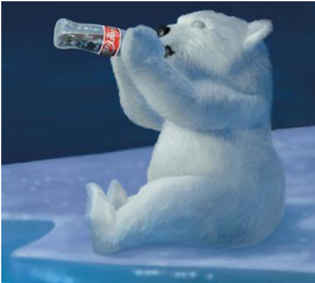
A fehérek ihatják az aszpartámot...

Az aszpartamista lobby világszerte nagyon er?s, csak bizonyos vadmaterialista héberek hiányával megáldott területeken nem bírta eleddig érvényesíteni befolyását. Magyarországon lépten-nyomon beleütközünk a korcsosítók által promotált gusztustalanságokba, f?ként a külföldr?l behozott, globális szempontból tündökl? márkák tették magukévá ezt az összetev?t (kóka és popsi kólák termékei), de a gyanúsan olcsó üdít?k is veszélyeztetettek. Eközben a rákos és idegrendszeri megbetegedések burjánzanak, aranykorukat élik Hazánkban, az ?snépeséget 6 millióra leszállítani kívánó körök pedig enyves kezeiket dörzsölgetik. Aszpartámtól, nátrium-glutamáttól, fenil-alanint?l tizedel?dik a magyar gój, miközben az antimagyar zabáltatók méregdrága biokajáktól böffentenek visszhangot el?idézve.